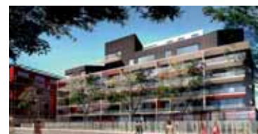
boogie - B.FEINTE architecte